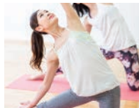
美人♥ヨガシリーズ