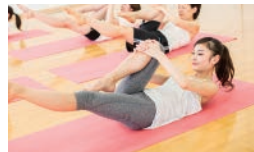
スタイルアッププログラム