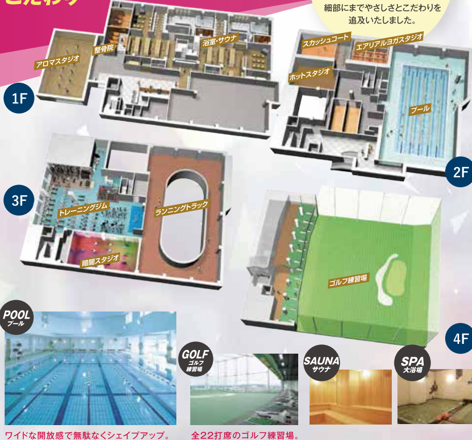
ワイドな開放感で無駄なくシェイプアップ。 全22打席のゴルフ練習場。

お客様一人一人、 スポーツクラブを 初めて利用される方から 上級者の方にも満足して いただけるよう、 ドゥ・スポーツプラザ高崎は 細部にまでやさしさとこだわりを 追及いたしました。