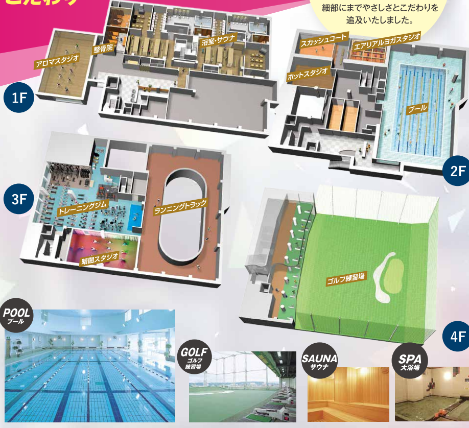
ワイドな開放感で無駄なくシェイプアップ。 全22打席のゴルフ練習場。

お客様一人一人、 スポーツクラブを 初めて利用される方から 上級者の方にも満足して いただけるよう、 ドゥ・スポーツプラザ高崎は 細部にまでやさしさとこだわりを 追及いたしました。