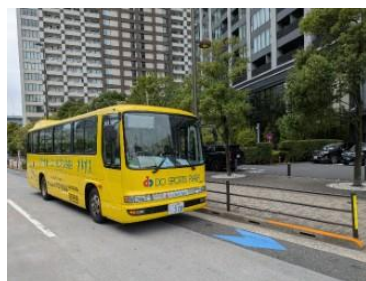
⑤勝どきザ・タワー前 (西仲通り)