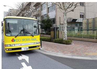
③月島第一小学校前 (電話ボックス前)