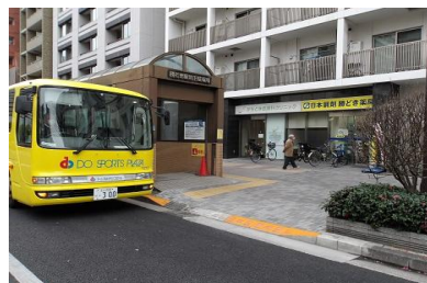
④勝どき四丁目 (地下駐輪場入口前)