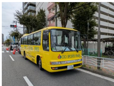
①越中島三丁目 アパート14号前 (郵便ポスト前)