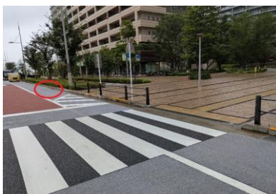
⑦晴海フラッグ 「晴海西郵便局」手前